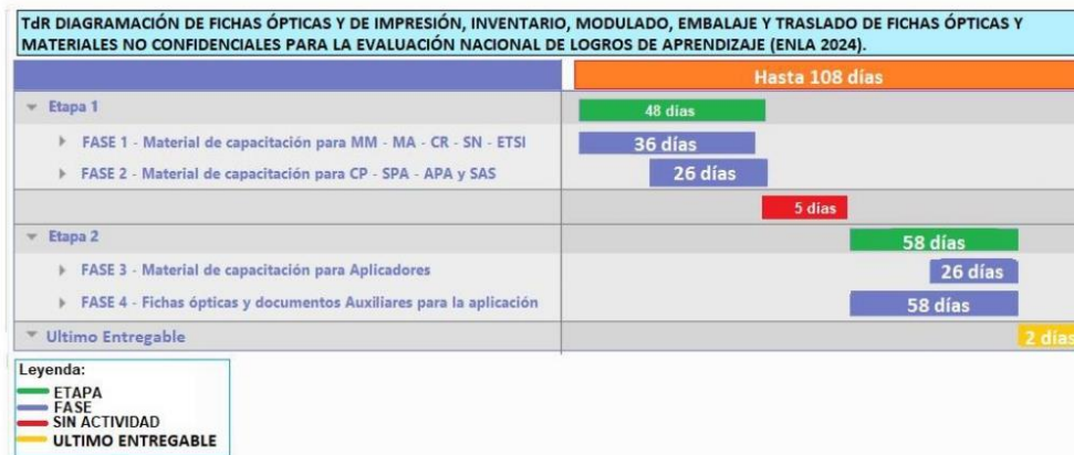
TABLA 01: Detalle de actividades de las Etapas y Fases del servicio