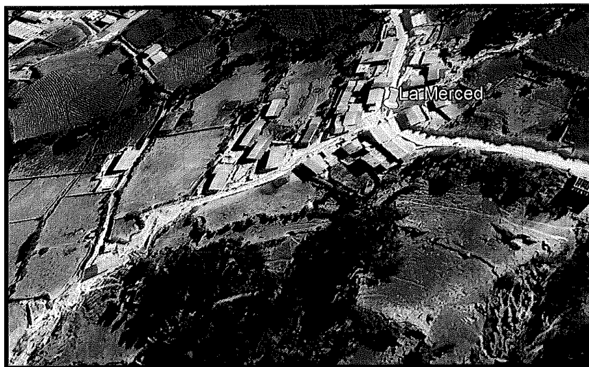
Lugar del proyecto.

El acceso a la localidad de Huacachi desde la ciudad de Huaraz, se encuentra descrita según el cuadro que continuación de detalla: