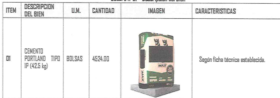
Cuadro N°01 – Descripción del Bien

No corresponde en el presente Especificación Técnica