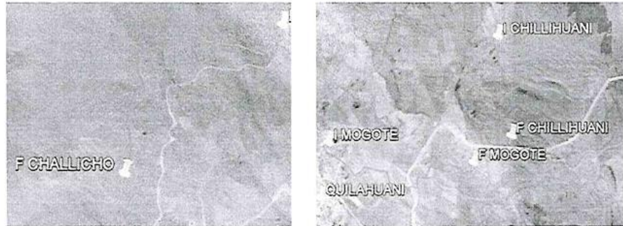
Fotografía N°01. Y N° 02. - Se aprecia vista Aérea de los canales en mención

El presente procedimiento de selección tiene por objetivo la contratación del Servicio de Consultoría para la Supervisión de la Ejecución de la Obra: "MEJORAMIENTO DEL SISTEMA DE CONDUCCION DEL SERVICIO DE AGUA DEL SISTEMA DE RIEGO EN LAS SECCIONES RIEGO LOSA, CHILLINI, CHALLICO Y MOGOTE DE LA LOCALIDAD QUILAHUANI, DISTRITO DE QUILAHUANI - CANDARAVE - TACNA" CUI 2310677.