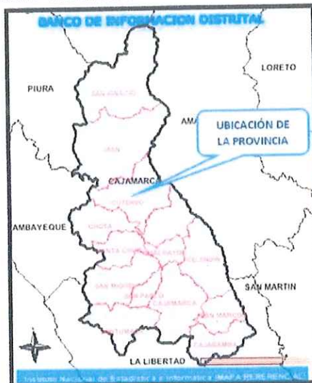
FIGURA N° 2: UBICACIÓN GEOGRÁFICA: DISTRITO DE CUTERVO