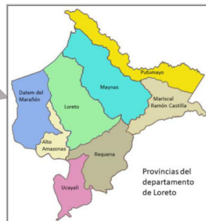
Mapa del Perú señalando el Mapa de Loreto señalando Departamento de Loreto La Provincia de Datem del Marañón