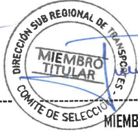
MIEMBRO TITULAR I