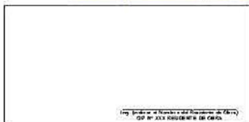
F01: (Fotografía Grupal del Personal Clave Georeferenciada Inicio de semana)