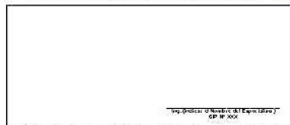
F06: (Fotografía Grupal del Personal Clave Georeferenciada Fin de semana)