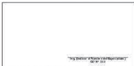
F09: (Fotografía Grupal del Personal Clave Georeferenciada Inicio de semana)