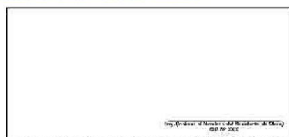
F04: (Fotografía Grupal del Personal Clave Georeferenciada Fin de semana)