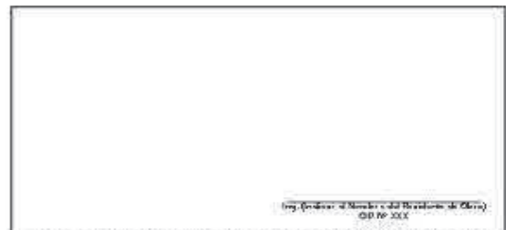
F04: (Fotografía Grupal del Personal Clave Georeferenciada Fin de semana)