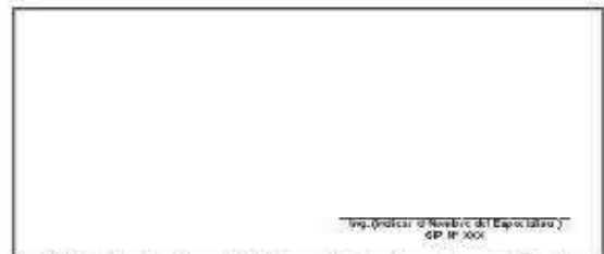
F06: (Fotografía Grupal del Personal Clave Georeferenciada Fin de semana)