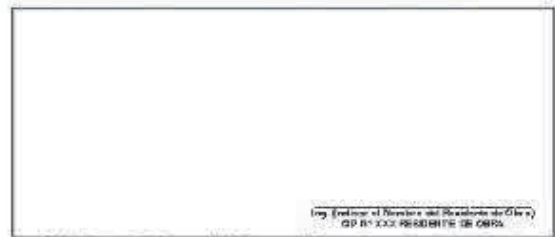
F02: (Fotografía Grupal del Personal Clave Georeferenciada Fin de semana)