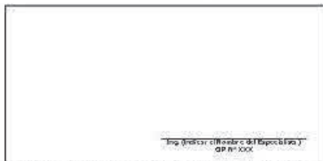
F07: (Fotografía Grupal del Personal Clave Georeferenciada Inicio de semana)