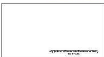
F03: (Fotografía Grupal del Personal Clave Georeferenciada Inicio de semana)