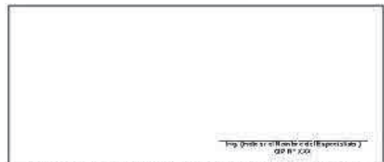
F08: (Fotografía Grupal del Personal Clave Georeferenciada Fin de semana)