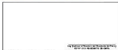
F02: (Fotografía Grupal del Personal Clave Georeferenciada Fin de semana)