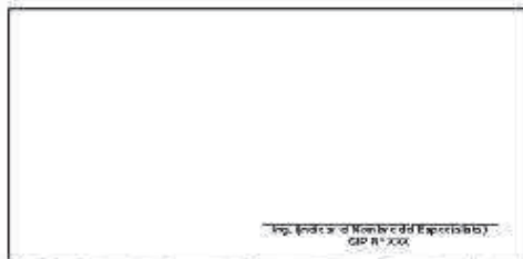
F05: (Fotografía Grupal del Personal Clave Georeferenciada Inicio de semana)