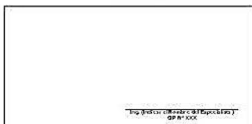
F07: (Fotografía Grupal del Personal Clave Georeferenciada Inicio de semana)