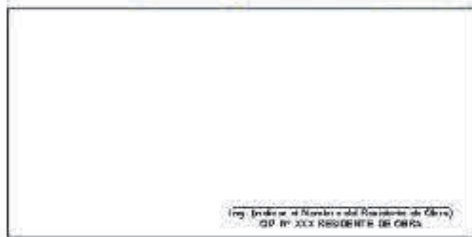
F01: (Fotografía Grupal del Personal Clave Georeferenciada Inicio de semana)