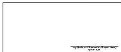
F08: (Fotografía Grupal del Personal Clave Georeferenciada Fin de semana)