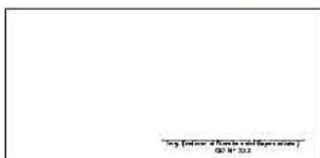
F09: (Fotografía Grupal del Personal Clave Georeferenciada Inicio de semana)