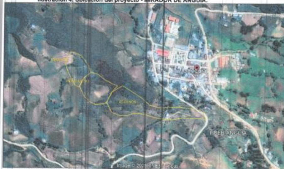
Ilustración 4. Ubicación del proyecto - MIRADOR DE ANGUIA.