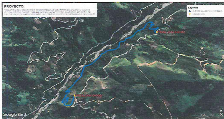
Imagen N° 02: satelital de área de estudio a intervenir