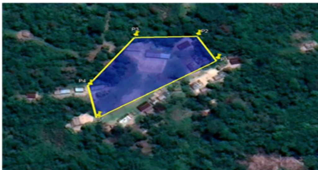
GRÁFICO N° 05: UBICACIÓN GEOGRAFICA SATELITAL DEL PROYECTO