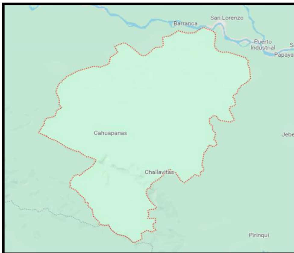
GRÁFICO N° 03: DISTRITO DE CAHUAPANAS