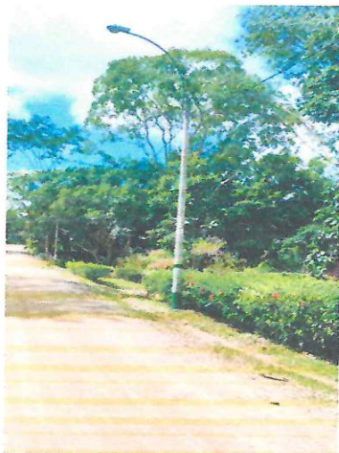
Poste de alumbrado Publico