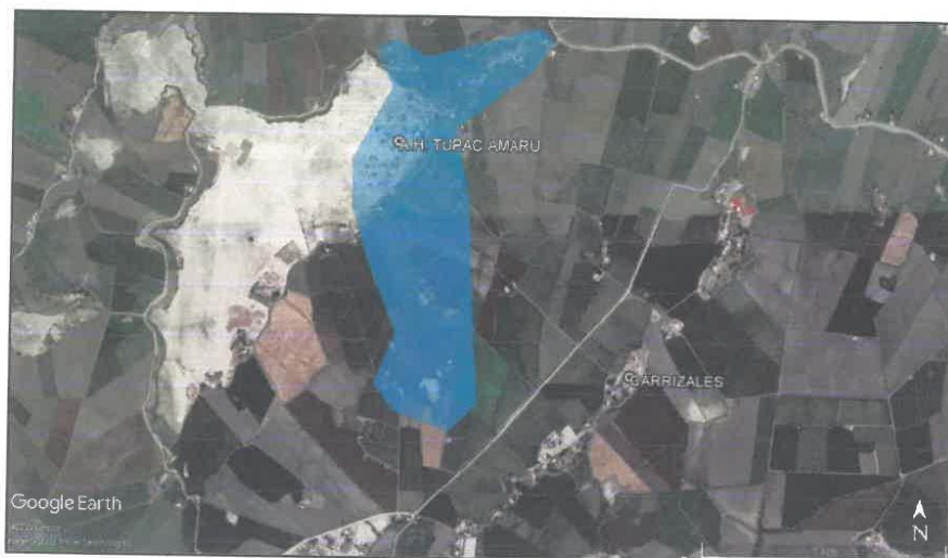
Imagen 01 - (vista satelital del A.H. Túpac Amaru)

La principal vía al proyecto desde la ciudad de Chimbote, capital de la provincia, hasta el A.H. Túpac Amaru es por la carretera Panamericana Norte, se ingresa hacia el este del ovalo del pescador (ingreso a Chimbote desde el norte) hasta llegar al C.P. Cambio Puente, en un tramo aproximado de 8 Km de carretera asfaltada. Ya en Cambio Puente se toma una carretera de afirmado trocha hasta el A.H. Túpac Amaru, la longitud de este tramo es 6.00 Km.