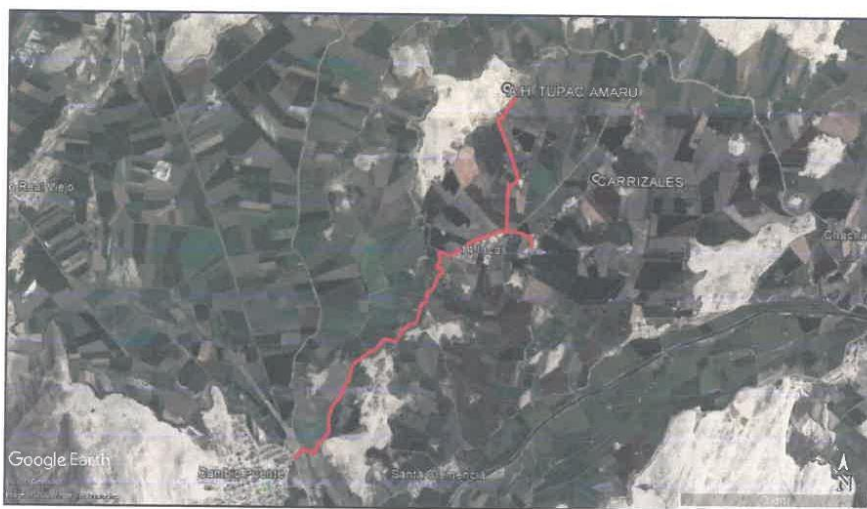
Imagen 03. Acceso a la zona del Proyecto Distrital.