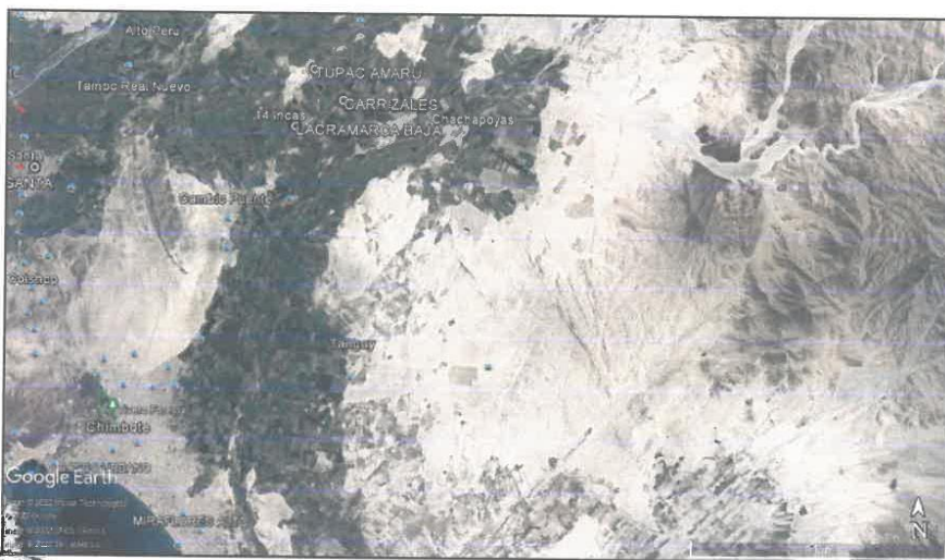
Imagen 02 – Acceso a la zona del Proyecto Provincial.