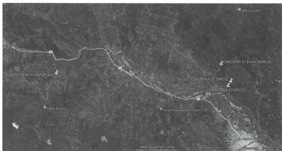
Ubicación de canteras Huacamayo y Pumpuriani.

*Al terminar con los trabajos de extracción de roca, el contratista deberá realizar la limpieza de las canteras utilizadas.