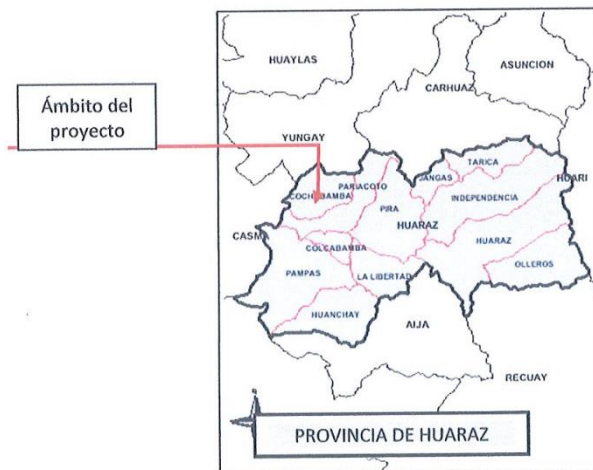
Figura N°02: Mapa de la Provincia de Huaraz y sus Distritos