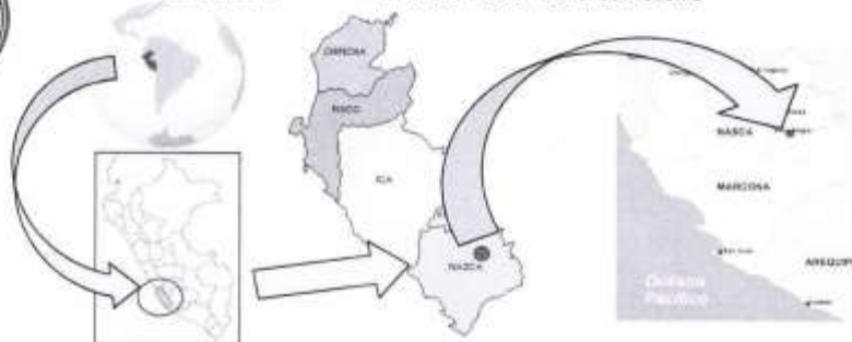
IMAGEN N° 01 - ESQUEMA DE LOCALIZACIÓN DEL PROYECTO

El distrito de Nasca se encuentra ubicado al Sur del departamento de Ica, colindante con la provincia de Paipa, a 130 Km al sur de la ciudad de Ica y a 443 Km al sur de la ciudad de Lima. Sus límites son: