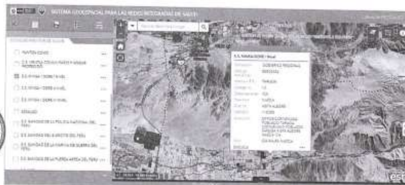
IMAGEN N°12- POSTA DE SALUD

El centro poblado de Taruga tiene una Posta de salud de categoría I-2 a cargo del Ministerio de Salud a través del Gore.