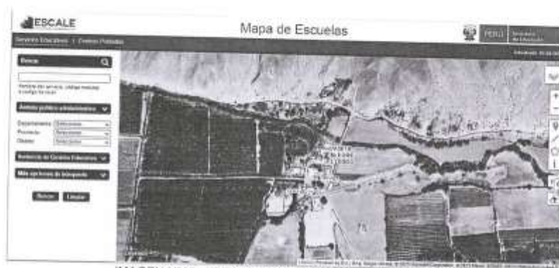
IMAGEN N°15- IE EN EL CENTRO POBLADO DE TARUGA

La ciudad de Nasca cuenta con servicio de telefonía fija y móvil, internet, canales de televisión de cobertura nacional, televisión por cable, canales de Tv. locales, radiodifusoras en FM, diarios y revistas de circulación nacional, además del servicio de correo.