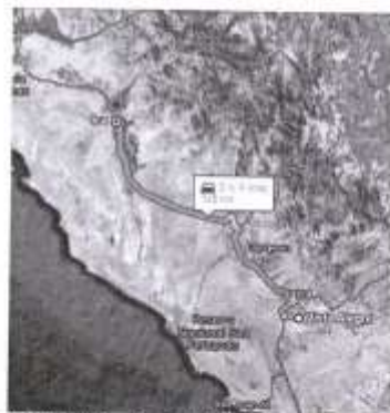
IMAGEN N°05 - RUTA TERRESTRE ICA - NASCA (165 KM)