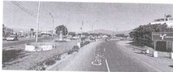
IMAGEN N°19 – VIA PRINCIPAL ACCESO AL DISTRITO DE NASCA

Sector IV: Pre Urbano: conformado por los asentamientos en proceso de consolidación como: José Carlos Mariátegui, Centro Poblado de Cantayoc, cubriendo un área aproximada de 30.60 Has de terreno pre urbano.