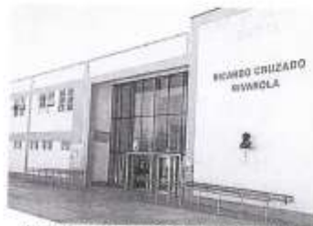
IMAGEN N°10- HOSPITAL DE APOYO