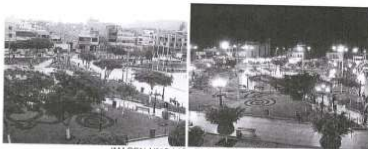
IMAGEN N° 18 / 19- PLAZA DE ARMAS

El ritmo de crecimiento demográfico está marcado por los ciclos económicos, el mayor ritmo de crecimiento se dio en el año 2000 debido al aumento del turismo en la provincia, así mismo, Nasca presenta un aumento de migración del campo a la ciudad en las últimas décadas puesto que en el área urbana se cuenta con mejores servicios y mejor acceso al desarrollo.