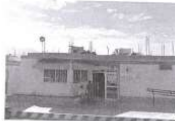
IMAGEN N°11- POSTA MEDICA

El centro poblado de Taruga tiene una Posta de salud de categoría I-2 a cargo del Ministerio de Salud a través del Gore.