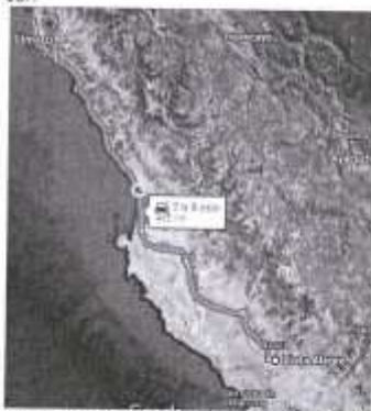
IMAGEN N°04 - RUTA TERRESTRE LIMA - NASCA (465 KM)

Para llegar al centro poblado de Taruga es desde ciudades de la costa, la principal vía de acceso es la terrestre y se utiliza la carretera Panamericana Sur (1S), hasta el cruce con la ruta IC-808 (Vía a nivel de afirmado) hasta llegar al centro poblado de Taruga. Si se parte desde Lima se deberá recorrer 465 Km, para llegar en aproximadamente 7 horas y 09 minutos; por la misma vía partiendo desde la ciudad de Ica, se debe recorrer una distancia de 165 Km viajando alrededor de 3 horas y 09 minutos, hacia el sur.