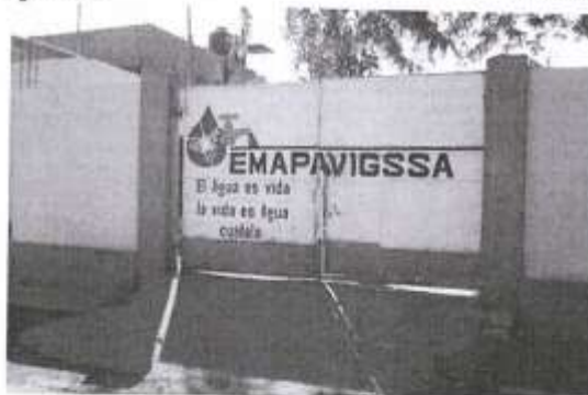
IMAGEN N°07- EPS EMAPAVIGSSA

El drenaje Nasca que cubre un área de 86.8 Has. da servicio al casco antiguo de la ciudad y asentamientos humanos cercano, descargan al emisor denominado "Nasca" ubicado al margen de la derecha del río Tierras Blancas. El drenaje "San Carlos", ubicado a la margen izquierda del río Tierras Blancas, cubre un área de servicio de 34.80 Has. descarga en el Emisor "San Carlos". El tratamiento final de los desagües, se realiza en una laguna de oxidación de 2 cámaras y las aguas servidas tratadas son utilizadas con fines agrícolas, con autorización del MINSA y el Ministerio de agricultura.