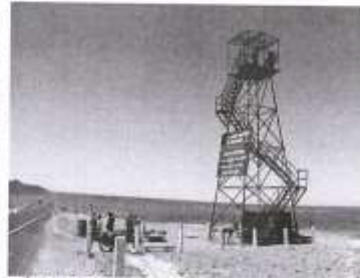
IMAGEN N°16 / 17- LINEAS DE NASCA