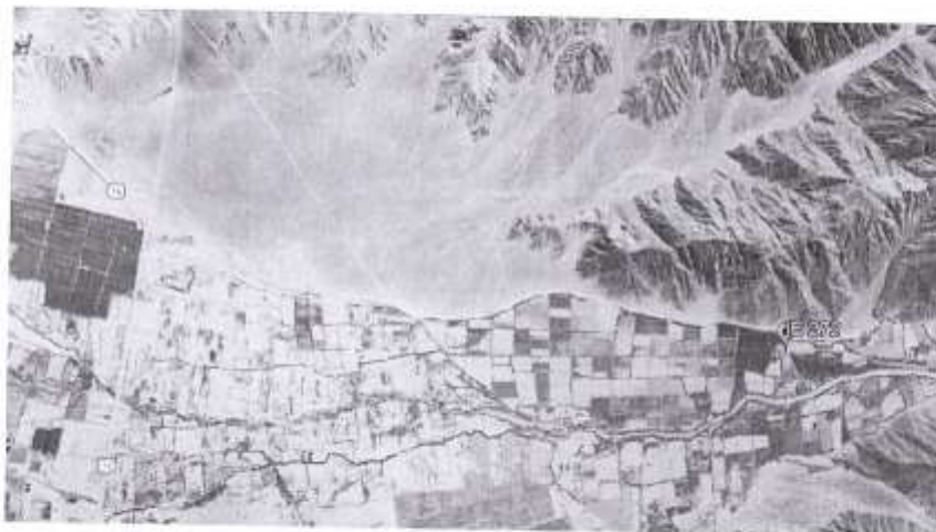
IMAGEN N° 03 – Principal Vía de acceso al Centro Poblado de Taruga