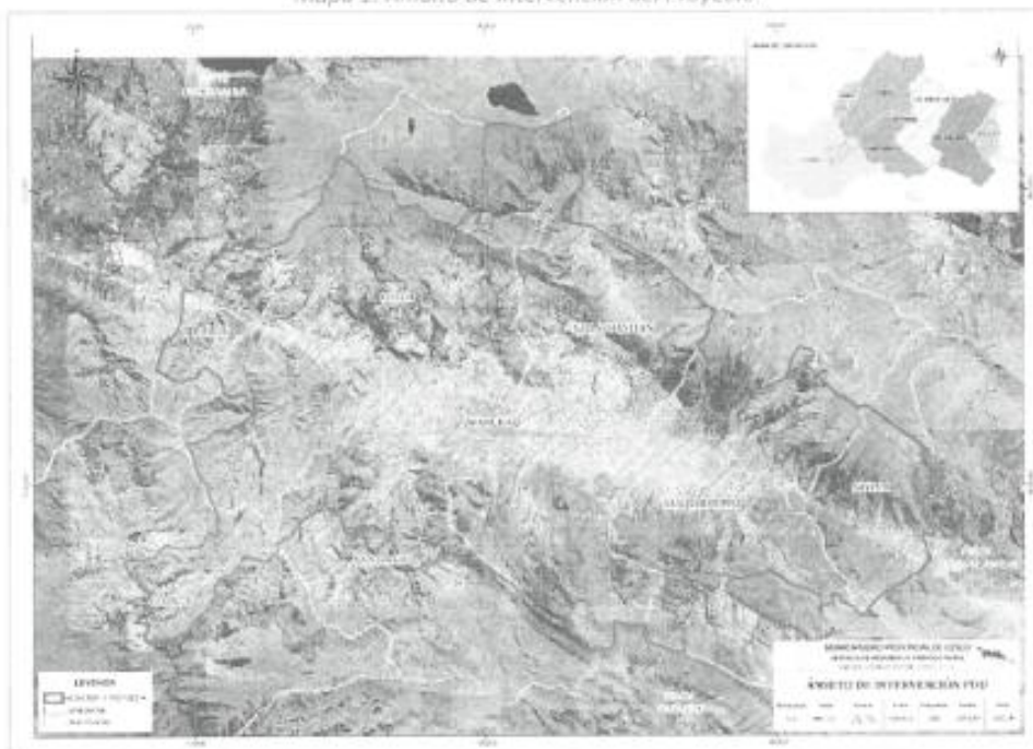
Mapa 1: Ámbito de intervención del Proyecto.

El ámbito de intervención del proyecto abarca un área de 272.00 km 2 , el cual involucra a los distritos de Cusco, Santiago, Ccorca, San Sebastián, San Jerónimo, Saylla, Poroy y Wanchaq en la provincia de Cusco del departamento de Cusco.