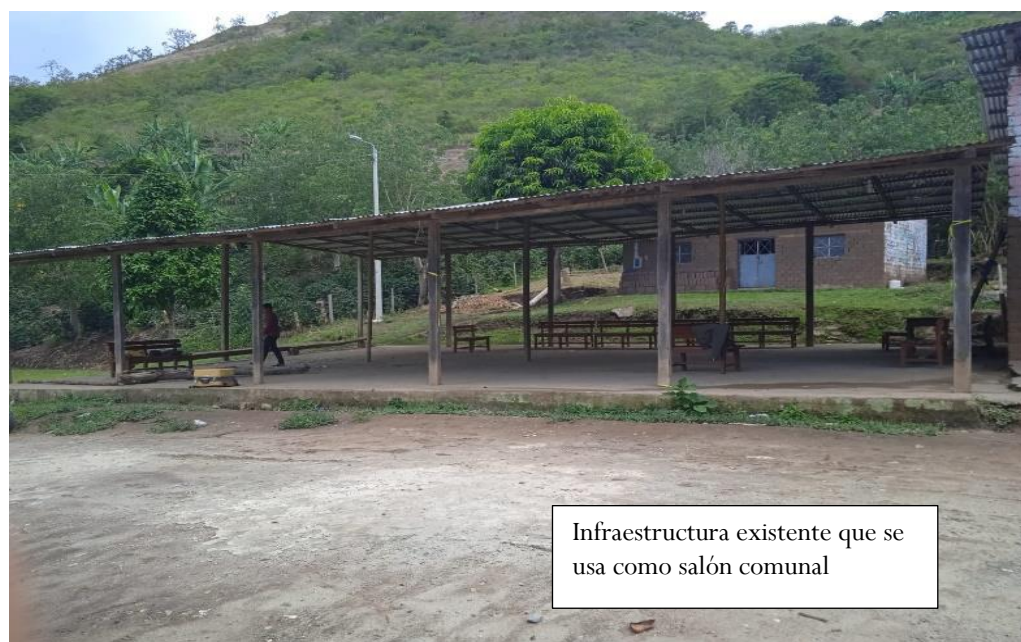
Infraestructura existente que se usa como salón comunal

El Caserío de San Andres cuenta con un espacio construido por la población de manera improvisada y sin ningún criterio de diseño construida en un terreno con un área de 228m 2 y 64 ml de perímetro que está ubicado frente al campo deportivo de dicho caserío.