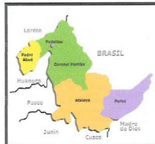
FIG. 02 Mapa macro localización del Departamento de Ucayali