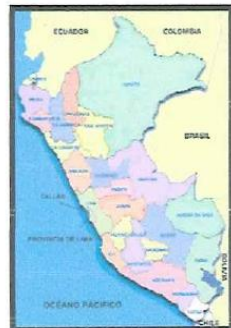
FIG. 01 Mapa de macro localización del Perú