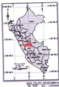
Imagen N° 01.- Vista de la Ubicación del Proyecto