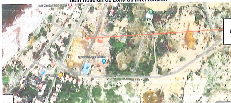
Gráfico N° 01 Identificación de zona de Intervención

Ubicación para la implementación de la centro de alto rendimiento