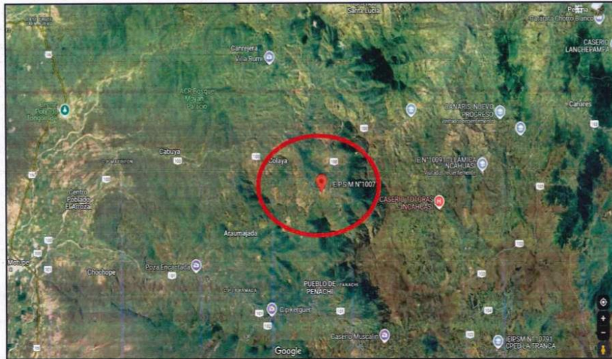
Cuadro 12: Ubicación de la I.E. (Maps)