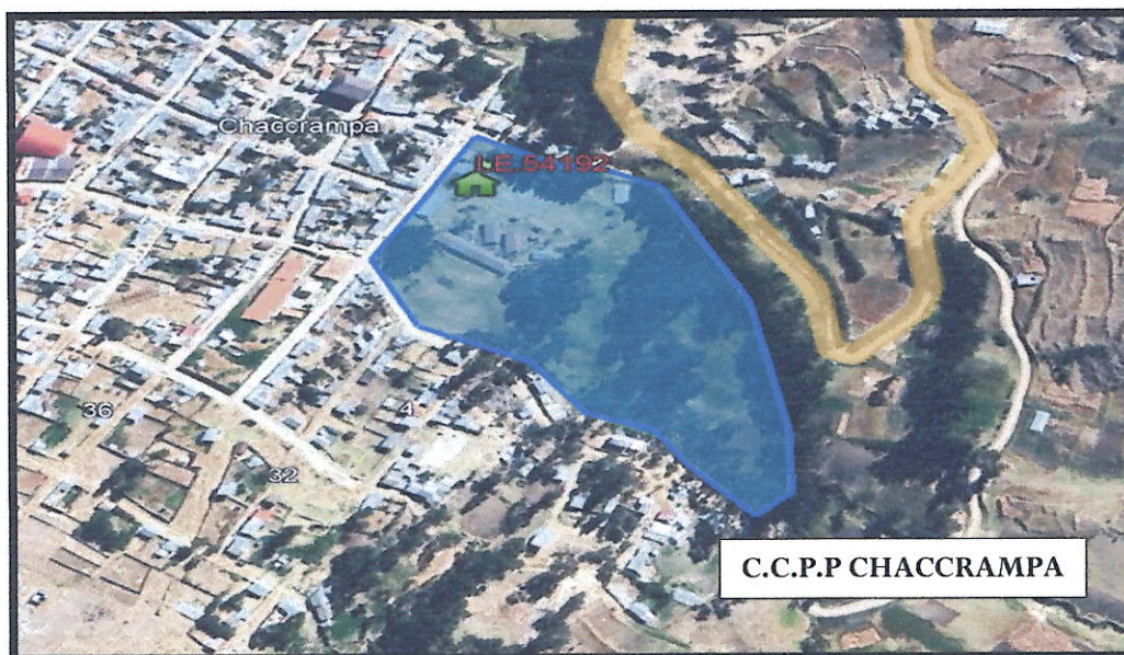
IMAGEN N° 01 MICRO LOCALIZACION DEL PROYECTO