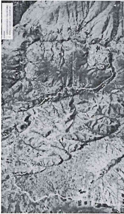
IMAGEN N° 01: CROQUIS RUTA DESVIÓ CARRETERA CUSCO-PAUCARTAMBO – DISTRITO COLQUEPATA

NOTA: para tener mayor referencia de la ubicación de entrega del bien, se muestra la imagen N° 01