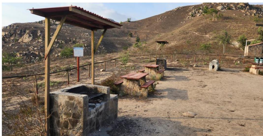
Fotografía N° 6: Zona de campamento (mesa-banca y parrillas)

“DECENIO DE LA IGUALDAD DE OPORTUNIDADES PARA MUJERES Y HOMBRES” “AÑO DE LA UNIDAD, LA PAZ Y EL DESARROLLO”