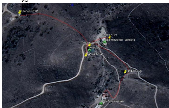
Mapa N° 01: Representación gráfica de la distribución del sistema de almacenamiento de agua, la línea roja representa la conexión de tubo de PVC