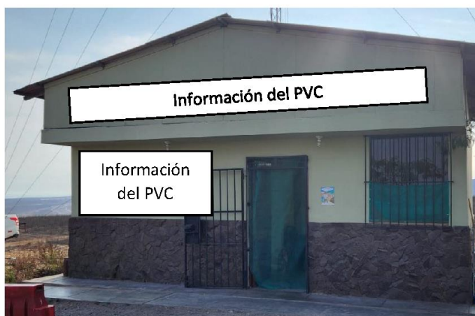
Fotografía N° 2: Zócalos y pared del PVC Hierba Buena