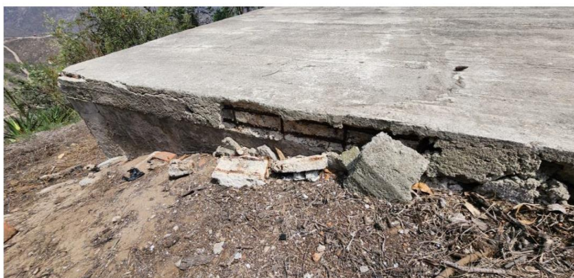
Fotografía N° 9: Tanque de almacenamiento de agua

“DECENIO DE LA IGUALDAD DE OPORTUNIDADES PARA MUJERES Y HOMBRES” “AÑO DE LA UNIDAD, LA PAZ Y EL DESARROLLO”