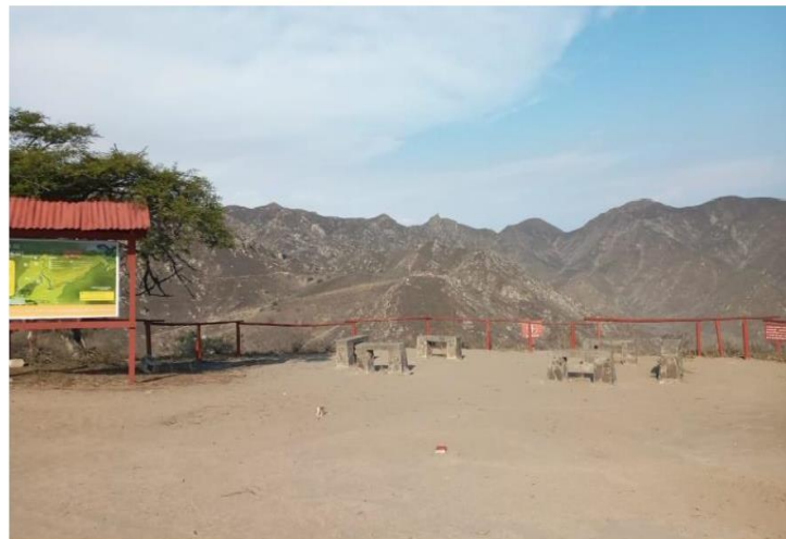
Fotografía N° 8: Mirador turístico

“DECENIO DE LA IGUALDAD DE OPORTUNIDADES PARA MUJERES Y HOMBRES” “AÑO DE LA UNIDAD, LA PAZ Y EL DESARROLLO”