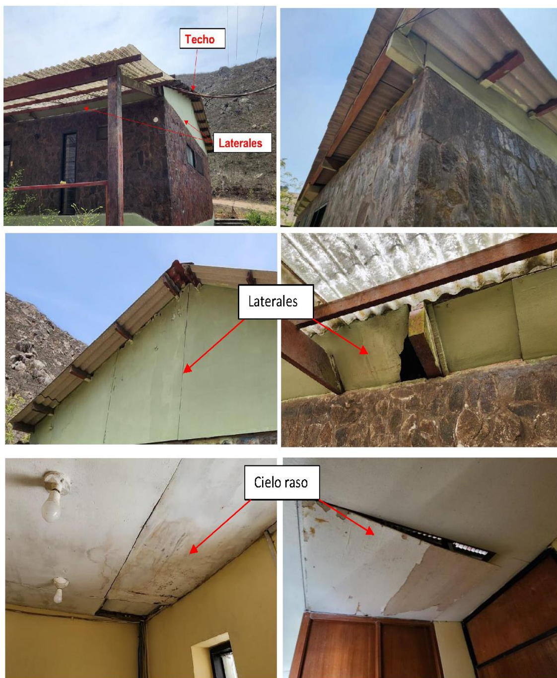
Fotografía N° 3: Techo y cielo raso del PVC Hierba Buena

“DECENIO DE LA IGUALDAD DE OPORTUNIDADES PARA MUJERES Y HOMBRES” “AÑO DE LA UNIDAD, LA PAZ Y EL DESARROLLO”