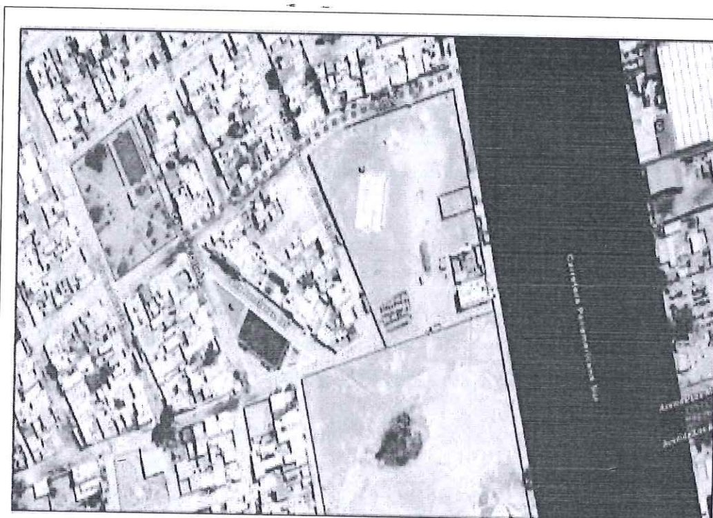
Plano de ubicación

Departamento : Lima Provincia : Lima Localidad : Asentamiento Humano Manuel Scorza Distrito : Pucusana