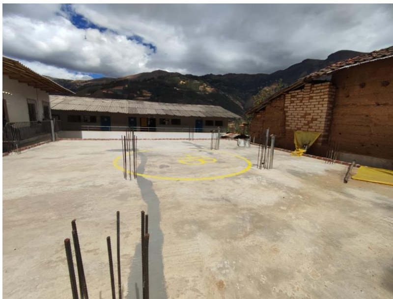
Imagen 01: Vista De Terreno Para La Construcción Del Proyecto

La Institución Educativa Ciro Alegría del Distrito de Sartimbamba cuenta con un terreno disponible para la construcción de infraestructura, por lo que se proyecta realizar este anhelado proyecto.