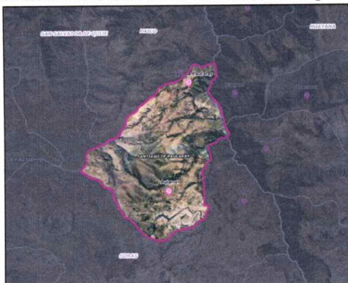
Mapa N° 1.4: Vista satelital de los límites del Distrito de Paucaray

Fuente: Google Earth / Elaboración: Equipo de trabajo.