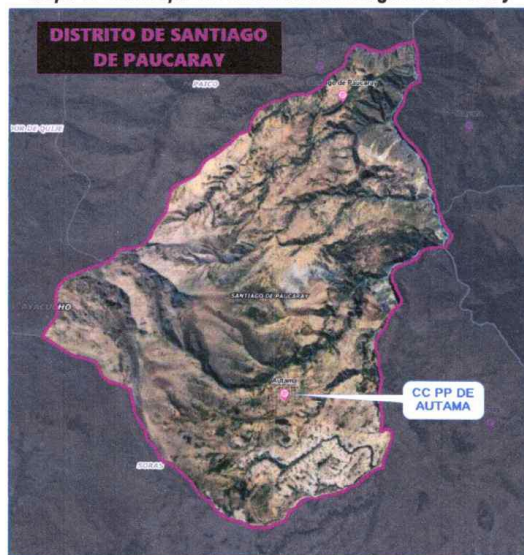
Mapa N° 1.2: Mapa del Distrito de Santiago de Paucaray

Fuente: Google Earth / Elaboración: Equipo de trabajo.