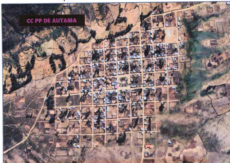
Mapa N° 1.3: Vista satelital del CC PP de Autama

Sub Gerente de Infraestructura y Obras Públicas