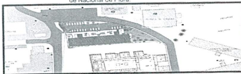
Auditorio de la Facultad de Ingeniería de Minas, en el Campus Universitario