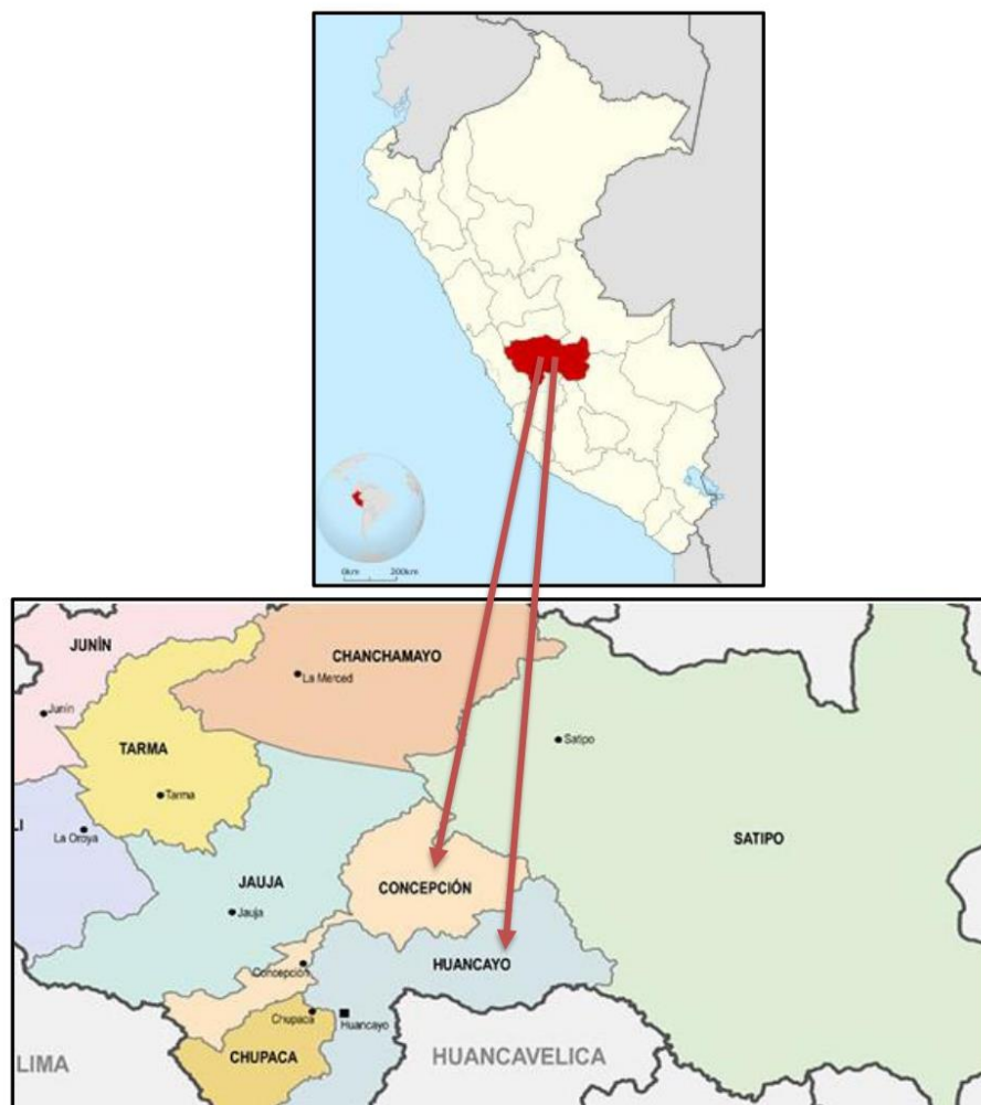
Fig. N° 01: Ubicación de Departamental y provincial del Proyecto