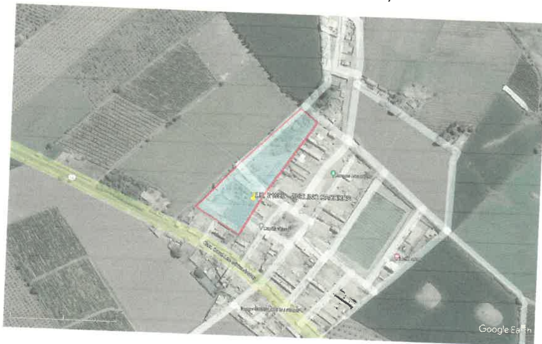
GRAFICO N° 05: IMAGEN SATELITAL (AREA A INTERVENIR)

CONSTRUCCION DE CERCO PERIMETRICO Y AMBIENTE DE PREPARACION Y EXPENDIO DE ALIMENTOS; EN EL(LA) IE 21586 ANDRES AVELINO CACERES - SUPE EN EL C.P. CARAL, DISTRITO DE SUPE, PROVINCIA BARRANCA, DEPARTAMENTO LIMA" CUI N° 2563671