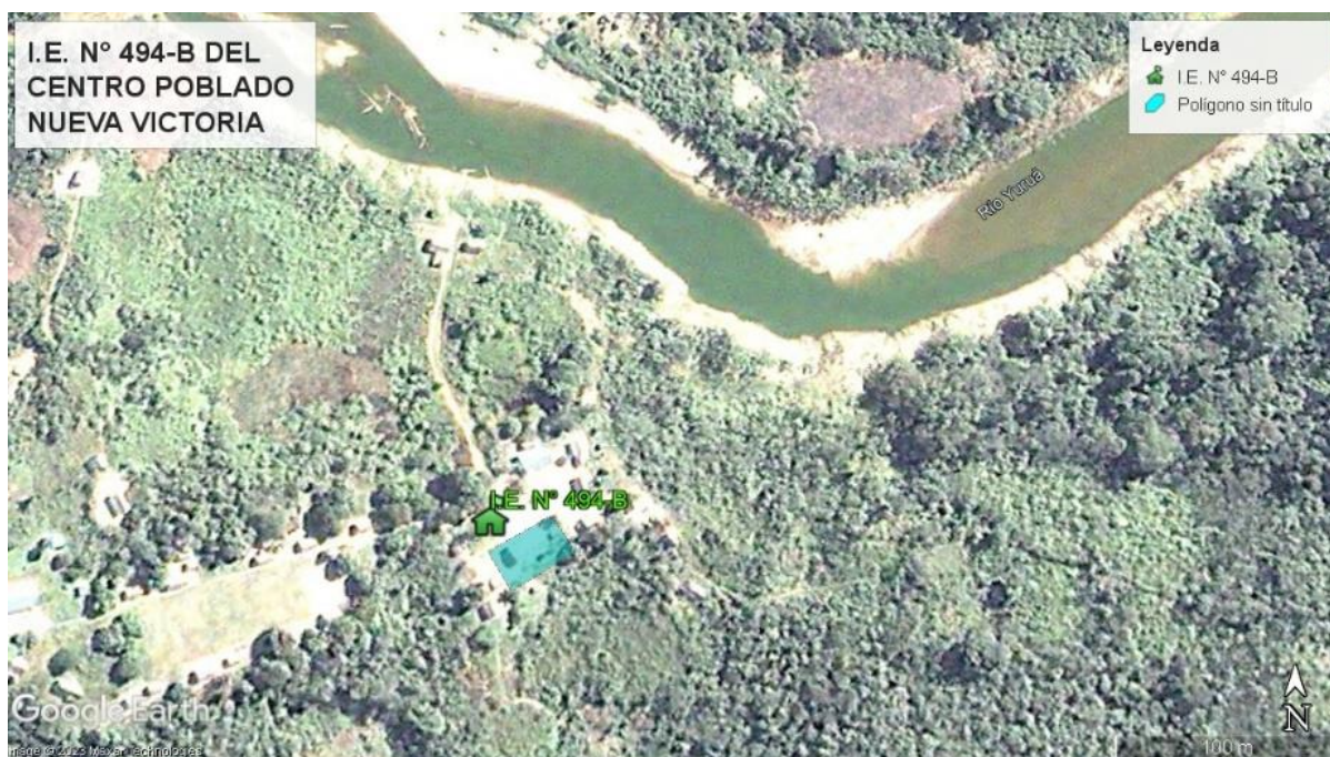
UBICACIÓN DE LA LOCALIDAD DEL CENTRO POBLADO DE NUEVA VICTORIA