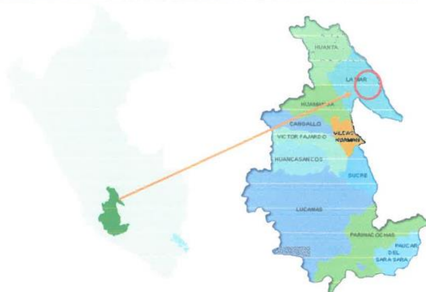
Imagen 01: Ubicación Nacional – Regional – Provincial