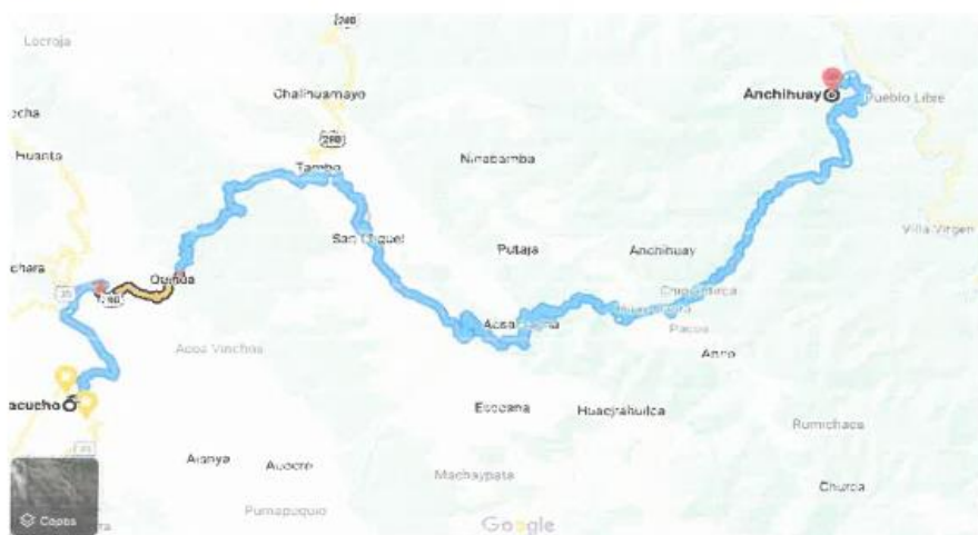
Imagen 02: UBICACIÓN DISTRITO DE ANCO – 6 DE Agosto – I.E. N° 425 – 159 /Mx-U

Desde la Ciudad de Ayacucho se puede llegar a la localidad de Villa U. Balsamocaca por vía terrestre siguiendo la siguiente ruta.