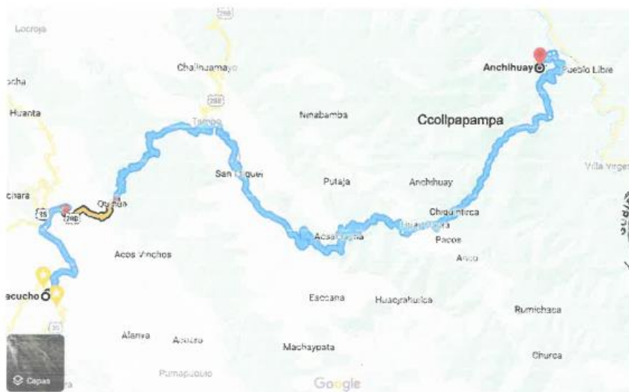
Imagen 02: UBICACIÓN DISTRITO DE ANCO – 6 DE Agosto – I.E. N° 425 – 159 /Mx-U

GOBIERNO REGIONAL AYACUCHO DIRECCION DE SUPERVISIÓN Y LIQUIDACIÓN DE OBRA