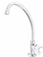
IMAGEN REFERENCIAL DEL PRODUCTO

LLAVE TIPO CUELLO DE CISNE DE BRONCE Grifería simple ubicada en mesa para lavamanos Material: Bronce Conexión de red a agua: fría Tipo de grifo: llave individual Material de cierre: bronce Entrada: 1/2" Uso: simple Estilo: clásico Procedencia: nacional