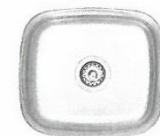
IMAGEN REFERENCIAL DEL PRODUCTO

LAVADERO DE ACERO INOXIDABLE DE 1POZA 36CM x 40CM Lavadero de acero inoxidable de una poza Material: Acero inoxidable calidad AISI 304 Acabado: satinado. Tamaño de gabinete: 41.1 x 45.2 cm Dimensiones internas de poza: 36 x 40 x 18cm Espesor: 0.8mm o mayor. Instalación: empotrada Corte para instalación 36 x 40cm Accesorios incluidos: desagüe redondo de acero inoxidable AISI 304. Procedencia: nacional Incluir: certificado de calidad