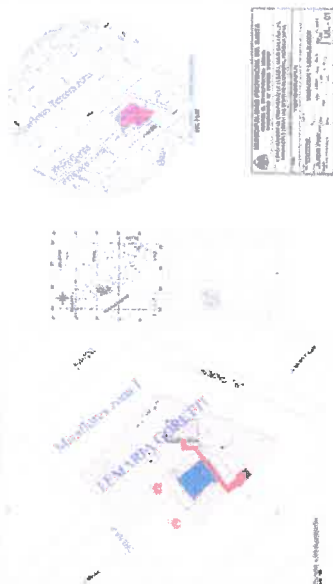
Imagen 01.- Ubicación del Proyecto.