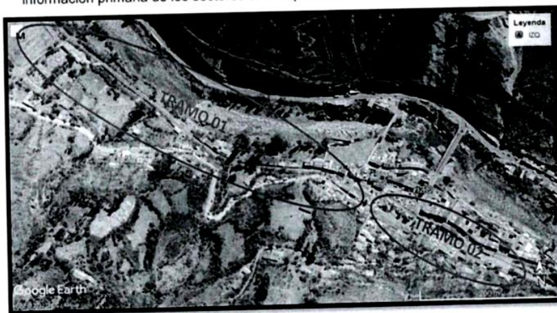
Imagen 1: Vista satelital de los sectores 7-Tramo 02,03