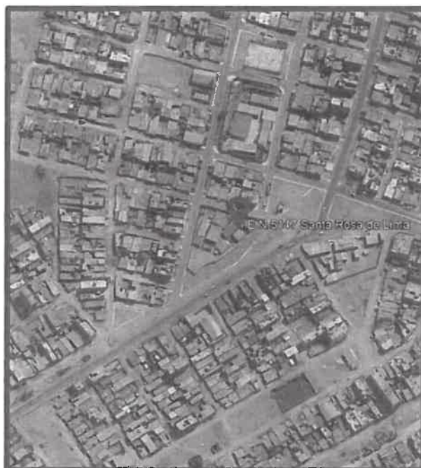
Figura N°1: Ubicación de la I.E. N°5147

El perfil del proyecto indica que se construirán las siguientes áreas: