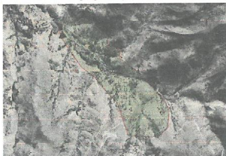
Imagen N° 01: Ubicación geográfica (coordenadas UTM) de la localidad a intervenir.

Requerimiento ejecución de obra: "AMPLIACION Y MEJORAMIENTO DEL SISTEMA DE AGUA POTABLE Y SANEAMIENTO DE LA LOCALIDAD DE EL PROGRESO, DISTRITO DE PROGRESO - GRAU - APURIMAC", CON CÓDIGO ÚNICO DE INVERSIÓN N° 2173704