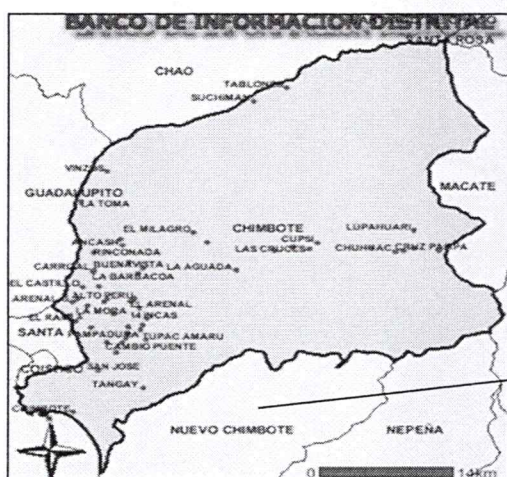
PROV. DEL SANTA