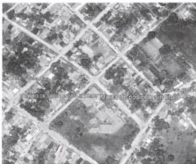
Esquema D1 – Ubicación del terreno donde se desarrollará el proyecto del C.S. I-4 PAMPA HERMOSA. -76.271338, -6.113327