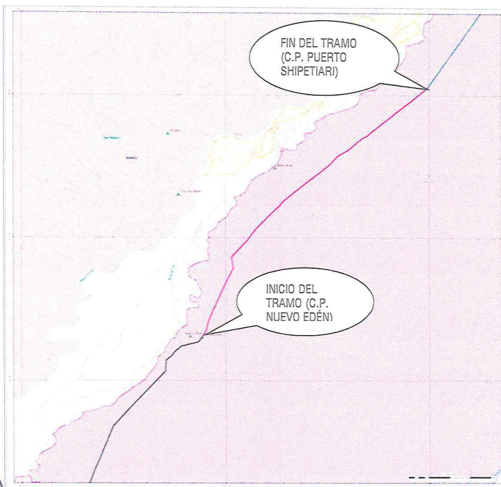
IMAGEN 02: Trayectoria del Camino Departamental (Tramo a intervenir)