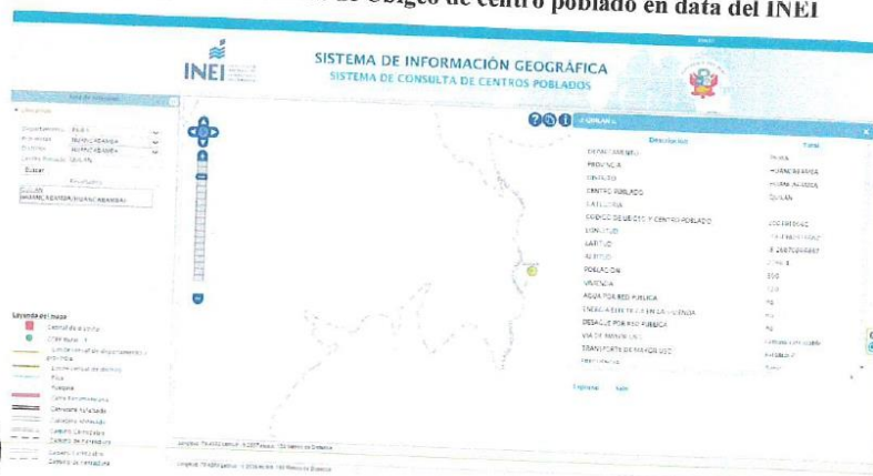
Imagen N° 01: Consulta de Ubigeo de centro poblado en data del INEI

Se deberá colocar el ubigeo de cada centro poblado del proyecto, según se muestra en la data del INEI. Para esto, se podrá acceder al sitio web: http://sige.inei.gob.pe/test/atlas/ .