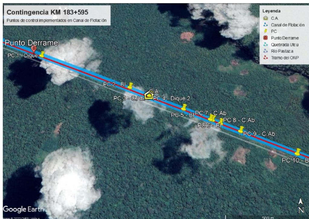
Figura 2. Puntos de Control instalados en el canal de flotación - Contingencia Ambiental km 183+595