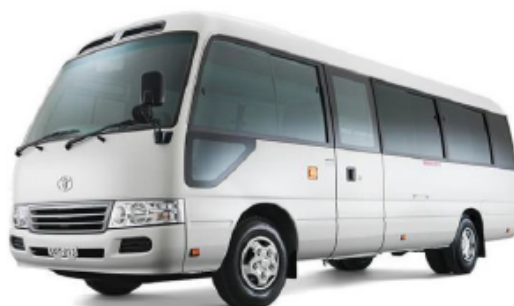
Imagen referencial de lo solicitado por Promperú