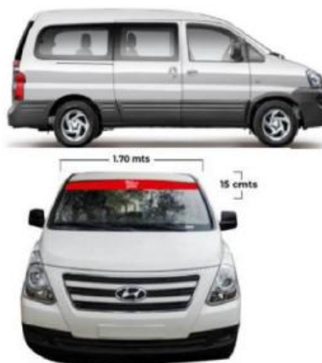
Imagen referencial de lo solicitado por Promperú