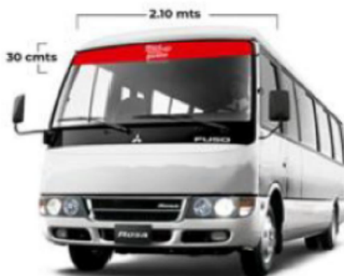
Imagen referencial de lo solicitado por Promperú