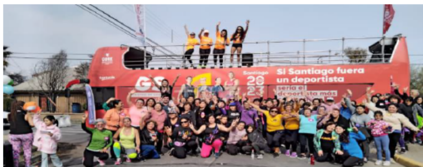
Imagen referencial de lo solicitado por Promperú