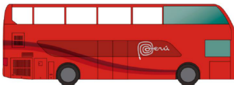
(*) Imagen referencial de lo solicitado por Promperú

La unidad vehicular que se proponga deberá tener una antigüedad no mayor a 10 años contados desde la fecha de presentación de las ofertas.