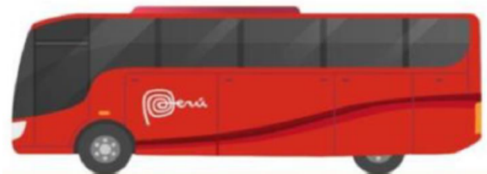
Imagen referencial de lo solicitado por Promperú

La unidad vehicular que se proponga deberá tener una antigüedad no mayor a 10 años contados desde la fecha de presentación de las ofertas