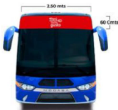
Imagen referencial de lo solicitado por Promperú