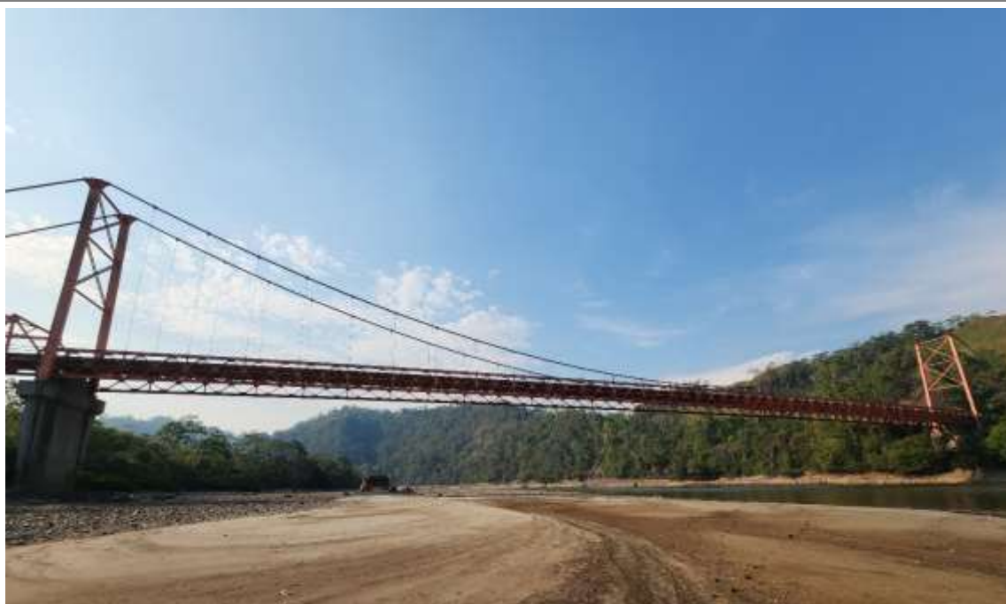
Vista 2. Vista desde aguas abajo