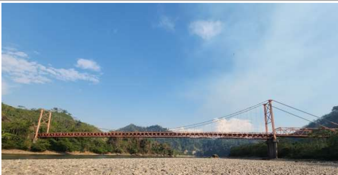
Vista 1. Vista desde aguas arriba

«Decenio de la Igualdad de Oportunidades para Mujeres y Hombres» «Año de la recuperación y consolidación de la economía peruana»