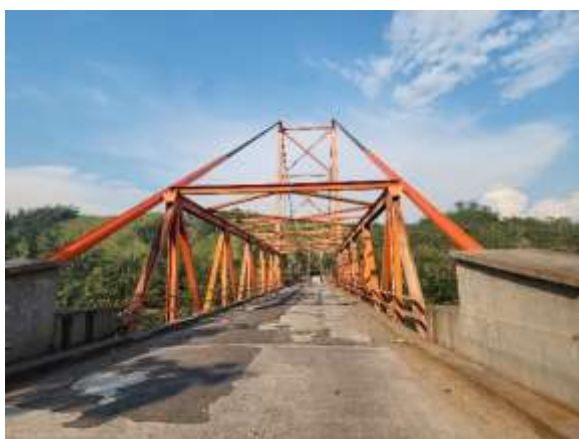
Vista 3. Vista de otros elementos

«Decenio de la Igualdad de Oportunidades para Mujeres y Hombres» «Año de la recuperación y consolidación de la economía peruana»