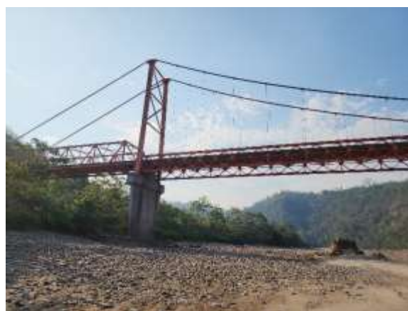
Vista 4. Vista de uno de los pilares