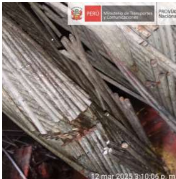
Vista 8. Vista de las hebras cortadas margen izquierdo aguas arriba