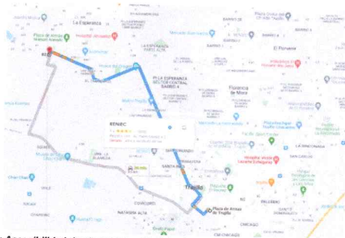
Imagen 1: Accesibilidad desde el centro histórico hasta el proyecto.