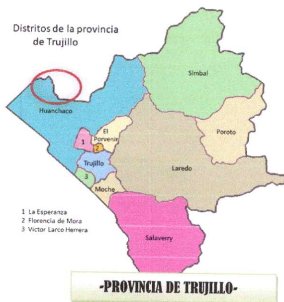
Ilustración 2. : Micro Localización del Proyecto