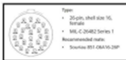
Imagen 02: Terminal del Digitalizador.