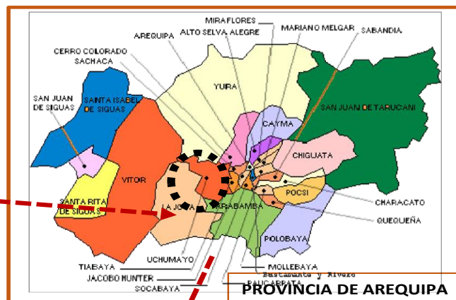
PROVINCIA DE AREQUIPA