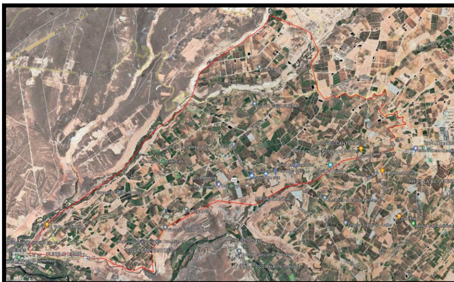
Imagen Área de intervención

La Intervención del proyecto se realizará en el Distrito de Uchumayo, el distrito cuenta con la distribución de los centros poblado y asentamientos humanos Podemos la ubicación exacta del lugar a intervenir en el para el Proyecto: