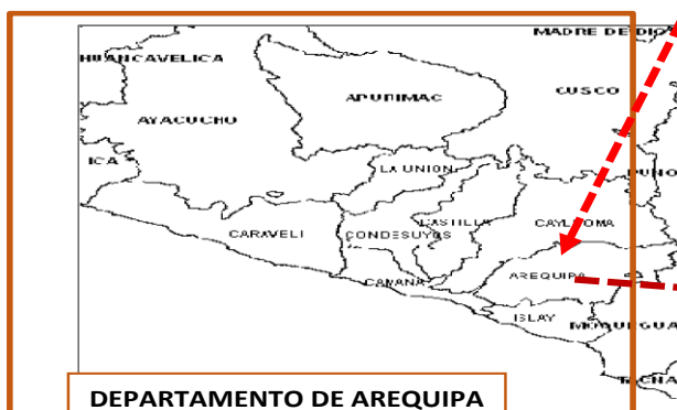
DEPARTAMENTO DE AREQUIPA