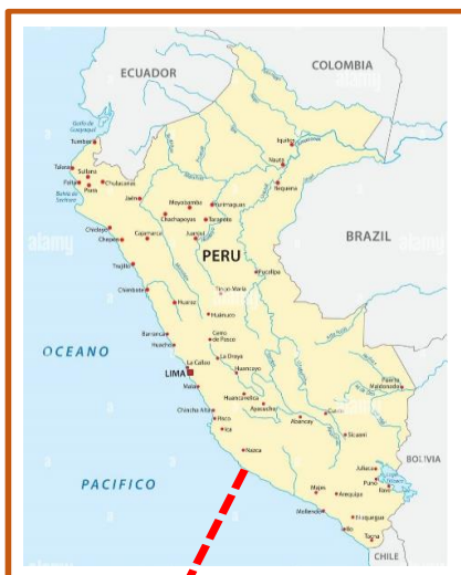
MAPA DEL PERÚ