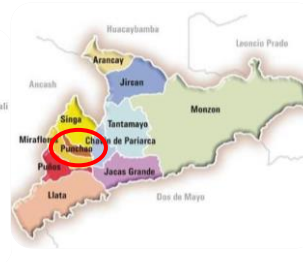
UBICACIÓN EN EL