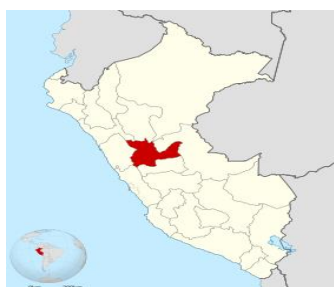
UBICACIÓN EN EL