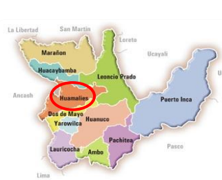
UBICACIÓN EN EL