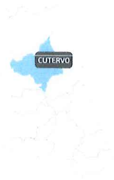
Figura N° A3: Ubicación Geográfica: Provincia de Cutervo