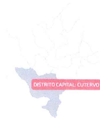
Figura N°A4: Ubicación Geográfica: Proyecto